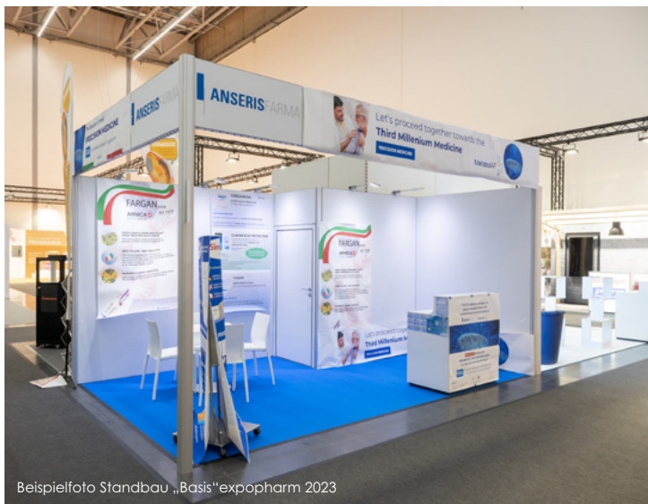
Beispielfoto Standbau „Basis“expopharm 2023