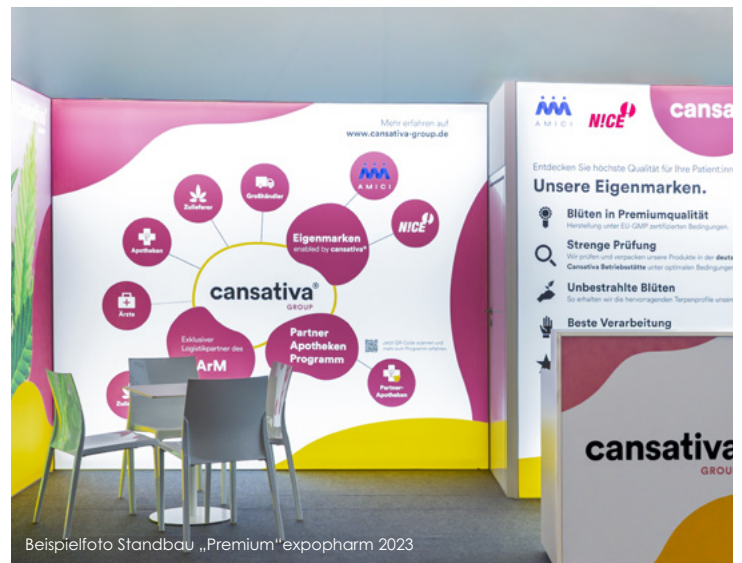
Beispielfoto Standbau „Premium“expopharm 2023